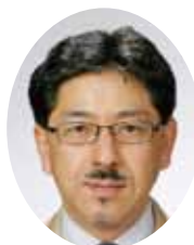
高橋 哲先生 九州歯科大学 口腔顎顔面外科学講座 形態機能再建学分野教授